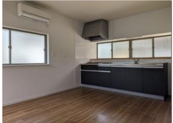
ダイニングキッチン8帖