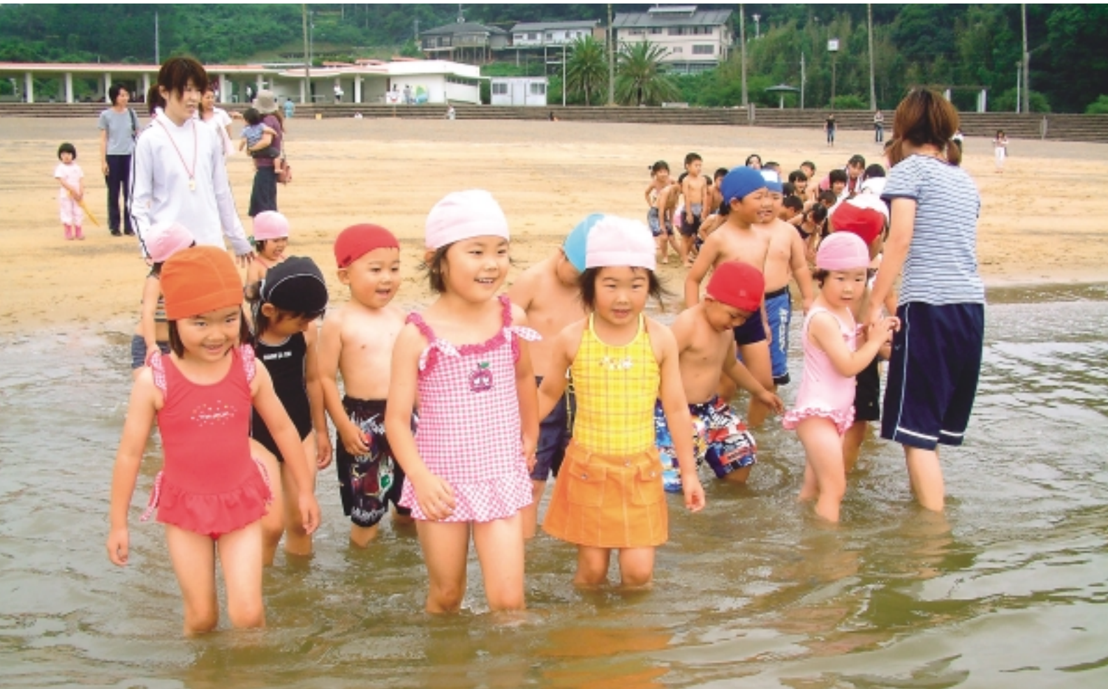
白浜海水浴場での海開き