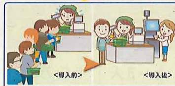
レジの精算時間が1.5倍の速さになり、預り金や釣銭の受け渡しの間違いがなくなった