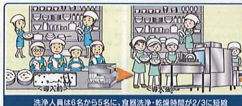
洗浄人員は6名から5名に、食器洗浄・乾燥時間が2/3に短縮