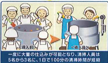
一度に大量の仕込みが可能となり、清掃人員は5名から3名に、1日で100分の清掃時間が短縮