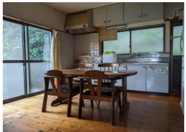
ダイニングキッチン8帖