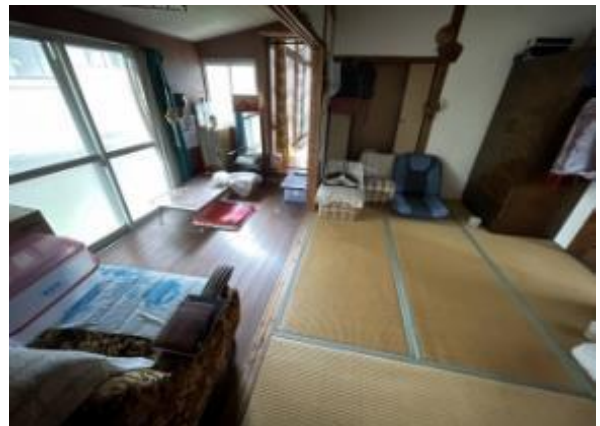
和室2 (6帖) 広縁