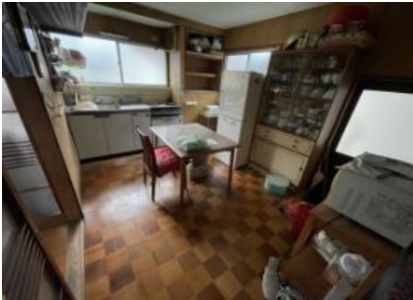
ダイニングキッチン（6帖）