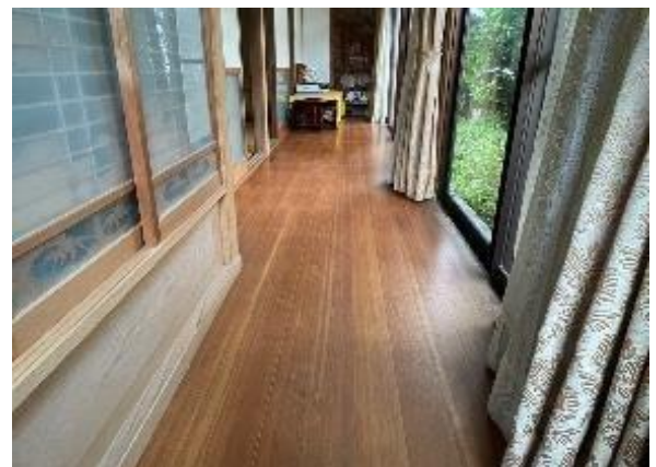
和室3 (10帖) 広縁