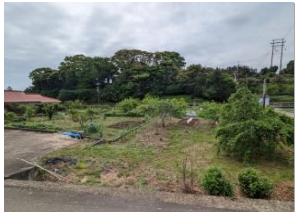
農地① いちじく、葡萄、桃などが収穫可