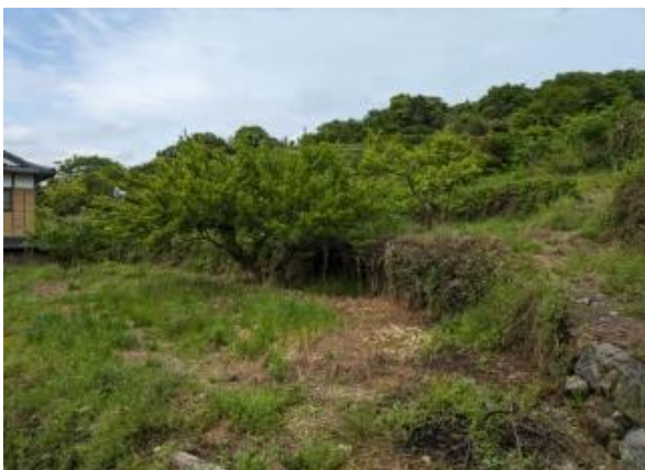
農地② 柿、プラム、梅などが収穫可