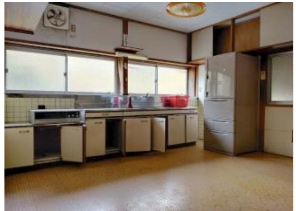
ダイニングキッチン