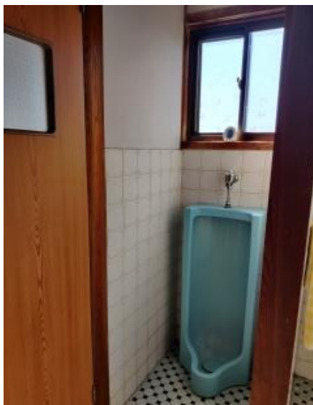
2 F 男性用トイレ