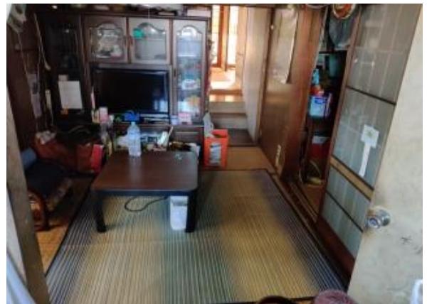
2F 和室 4帖