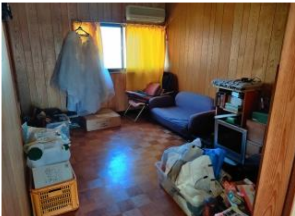
2F 洋室 6帖