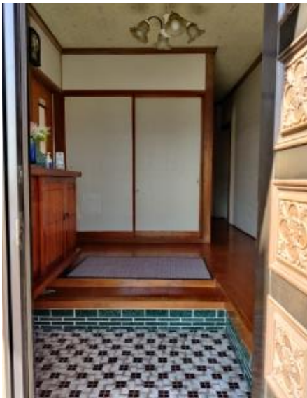
2 F 玄関