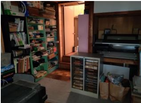
2F 和室 6帖