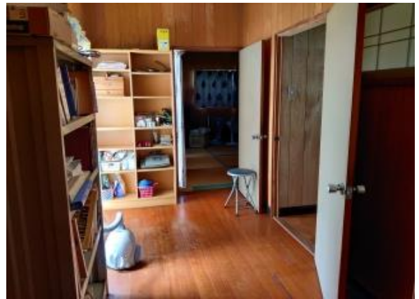
2F 洋室 4帖