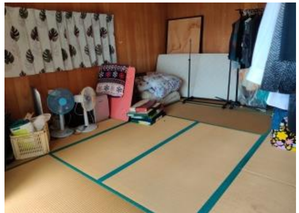
2F 和室 6帖