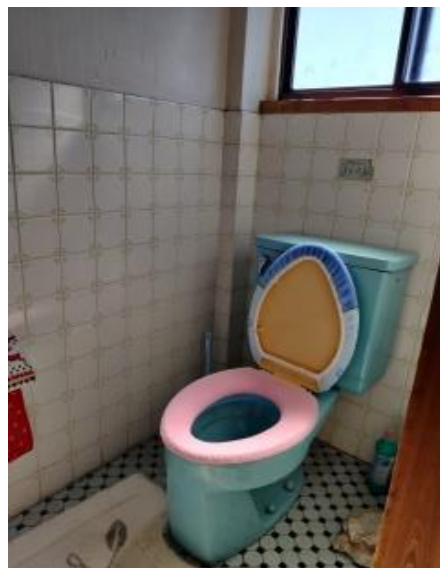
2 F 共用トイレ