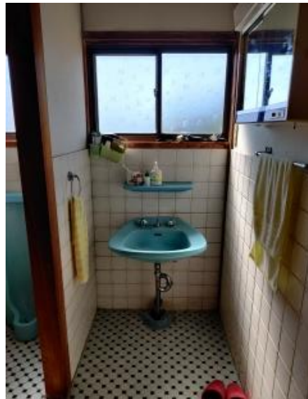
2 F 洗面所