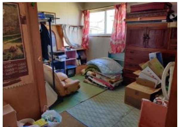
2F 和室 6帖