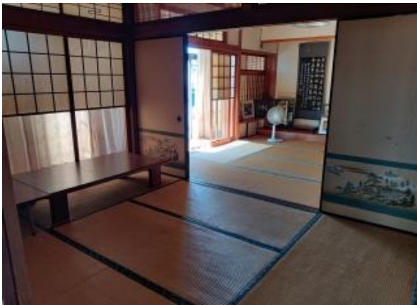
2F 和室 6帖