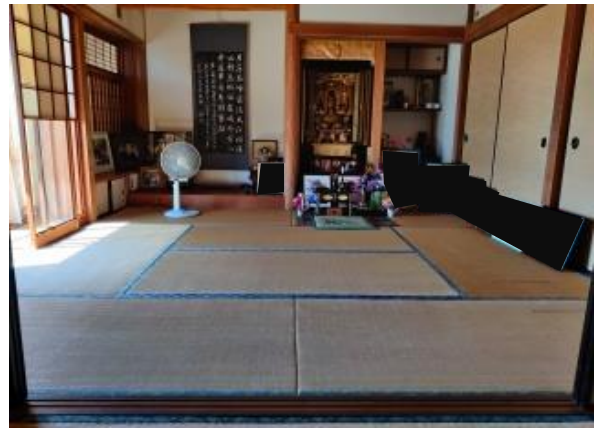
2F 和室 8帖