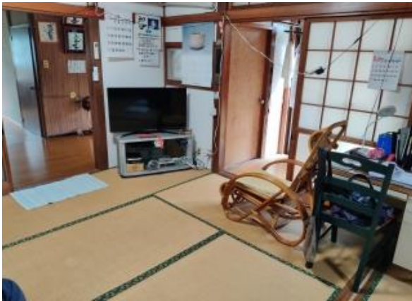
1F 和室 6帖