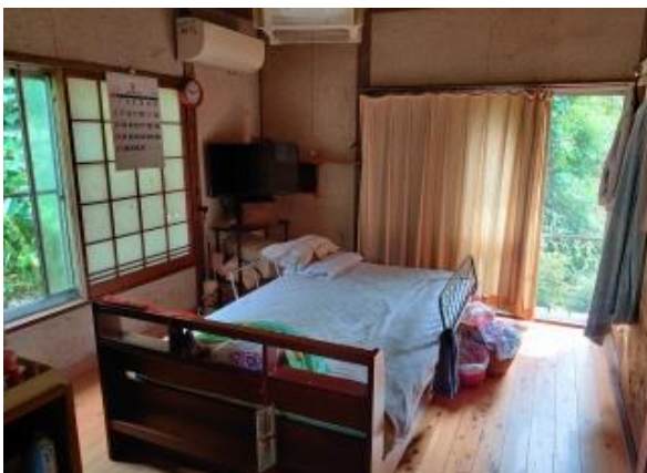
1F 洋室 6帖