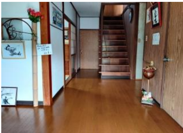
玄関ホール・階段