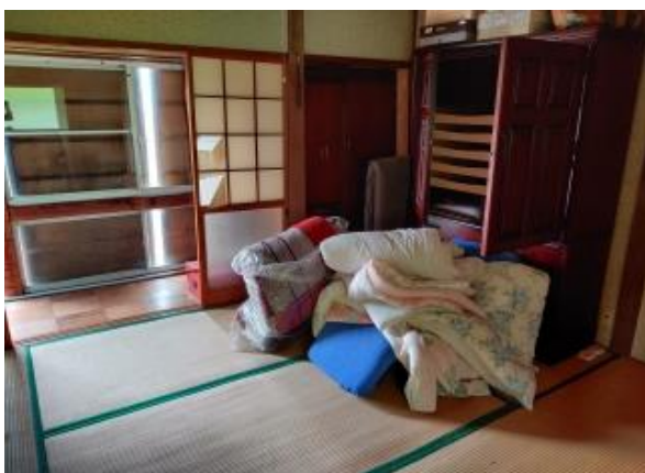
2F 和室 6帖