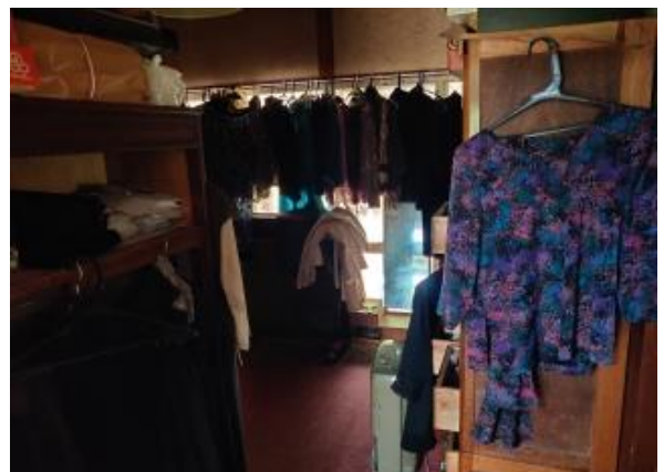
1F 洋室 4.5帖