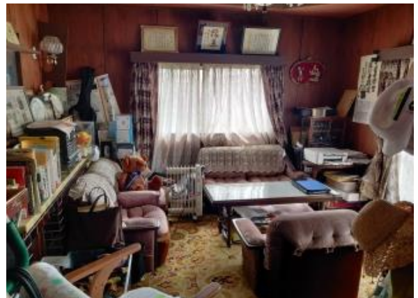
1F 洋室 8帖