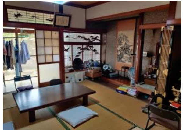
1F 和室 8帖