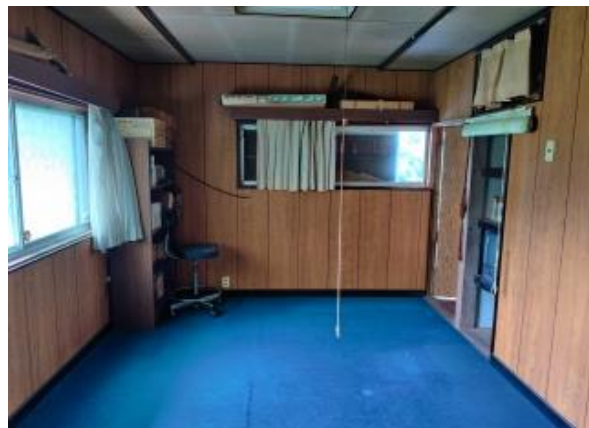
2F 洋室 6帖