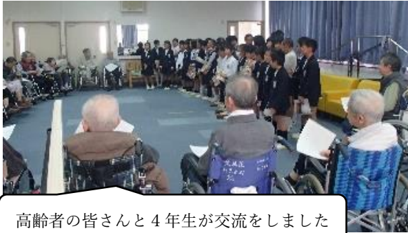
高齢者の皆さんと4年生が交流をしました