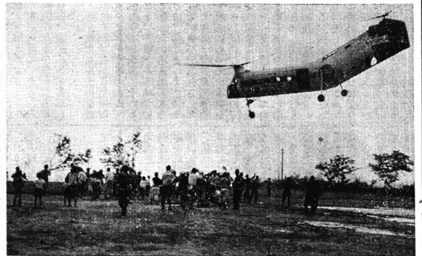
災害負傷者を多良病院へ輸送に活躍する自衛隊ヘリコプター(大浦中学校グラウンド)