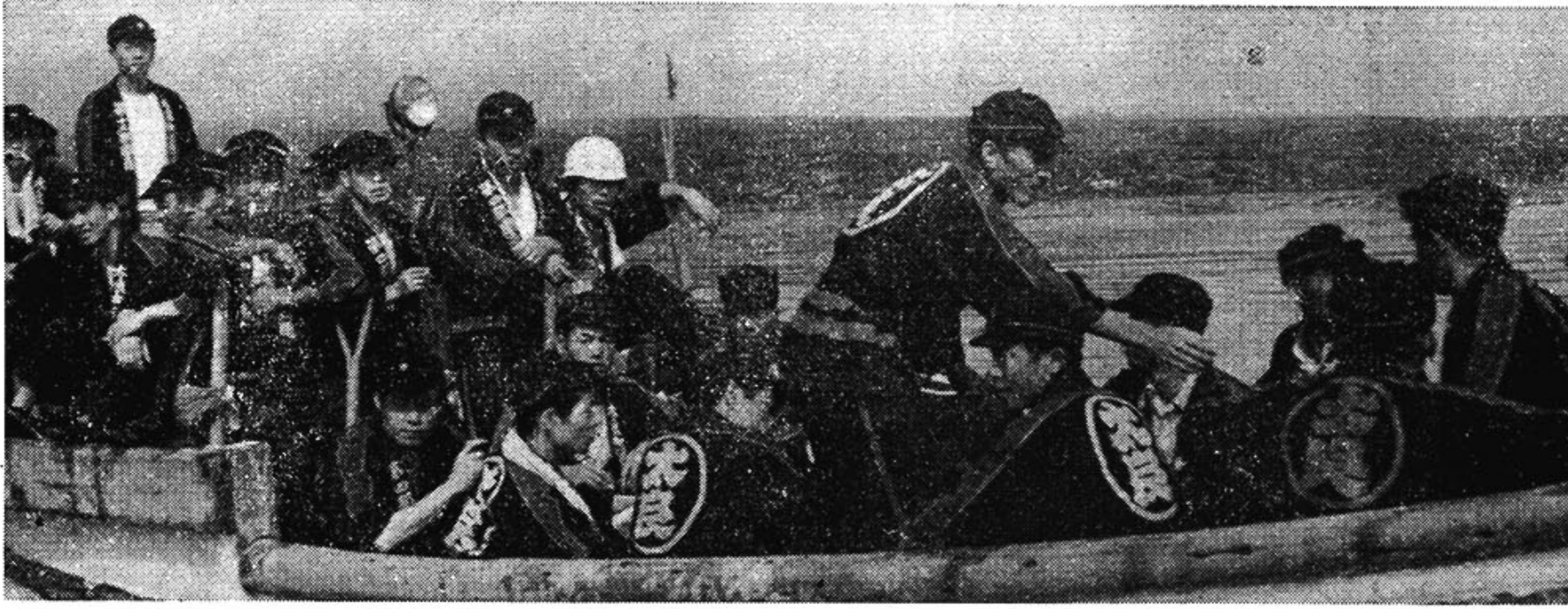
道路交通は不能、漁船で災害現場に向う多良消防団員