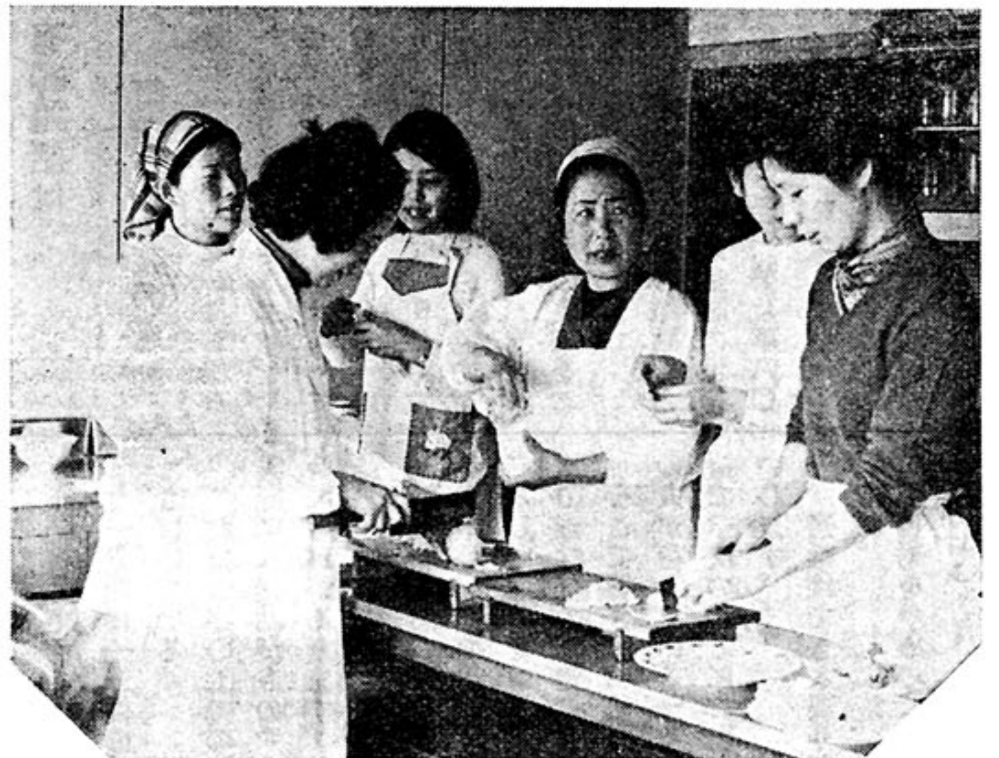
写真① 貴女も花嫁修業に参加しませんか 大浦青年、婦人学級合同の料理コースは、毎月第二土曜に開催女子青年は婦人から技術を修得して花嫁修業に大ハッスル。

神社社屋の解体、修理に因んでふるさとの歴史をしのび感無量となり一筆啓上申し上げた次第です。 3月1日から電報料金等がかわりました。 ●電報の料金 普通電報料は次のとおりです 基本料 25字まで150円 累加料 5字までごとに20円 ●次の制度は廃止されます ○市内電報、市外電報の区別 ○翌日配達電報