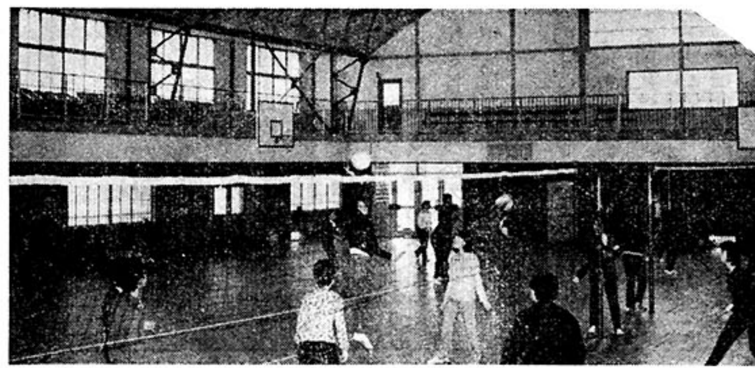
有線放送電話番号簿正誤表