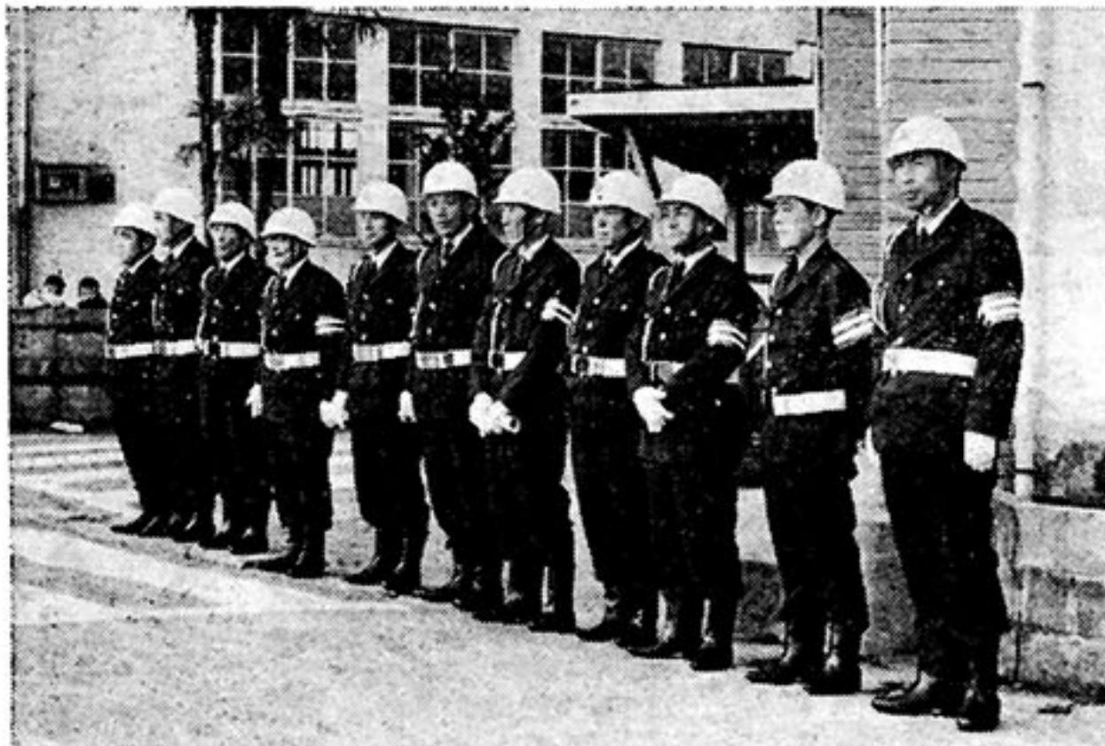
交通指導員誕生 町民の交通安全に期待される

に交通指導員を設置し、強力に春の交通安全運動を推進することとしています。町民のみならずお互いの尊い生命を守るために、安全意識を高めるようにとめまします。