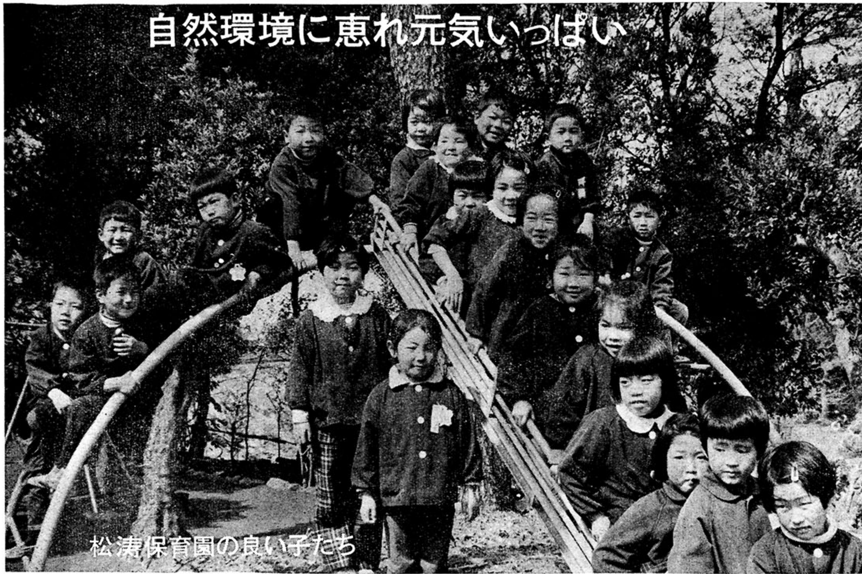
松涛保育園の良き子たち