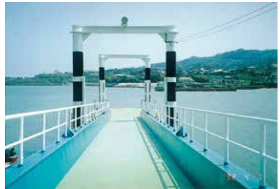
平成4年7月 大浦港浮棧橋完成