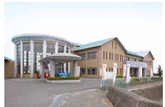
平成11年12月 太良町総合福祉保健センター「しおさい館」開所