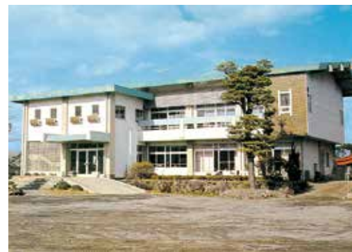
昭和45年3月 太良町老人福祉センター完成