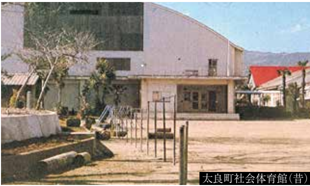
太良町社会体育館(昔)