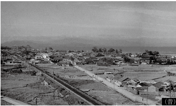
旧国道を中心に油津海岸を望む