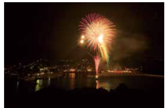
平成4年8月 第1回「太良町納涼夏まつり」開催