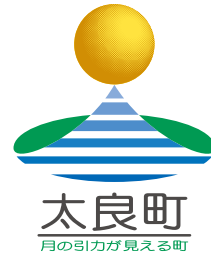
町のシンボルマーク