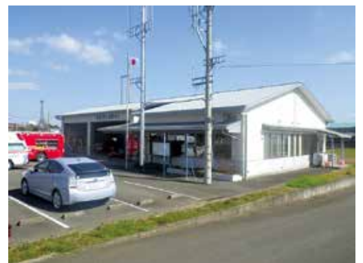
平成16年3月 杵藤地区広域消防・太良分署移転