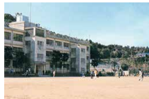
昭和38年3月 大浦小学校校舎完成