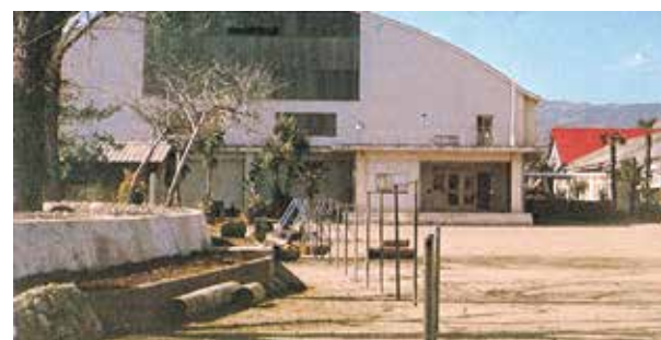
昭和39年7月 太良町社会体育館完成