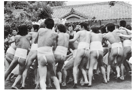
昭和60年1月 「竹崎観世音寺修正会鬼祭」 国の重要無形民俗文化財に指定