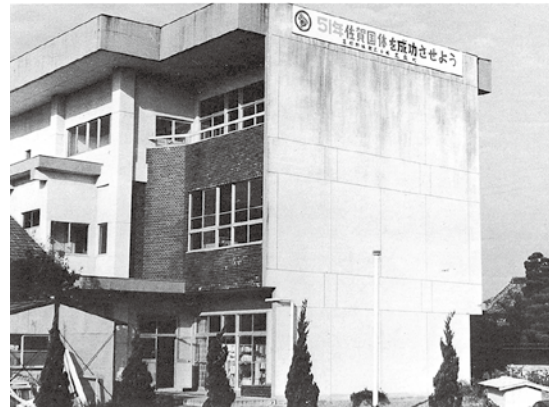
昭和43年5月 町立農村図書館完成