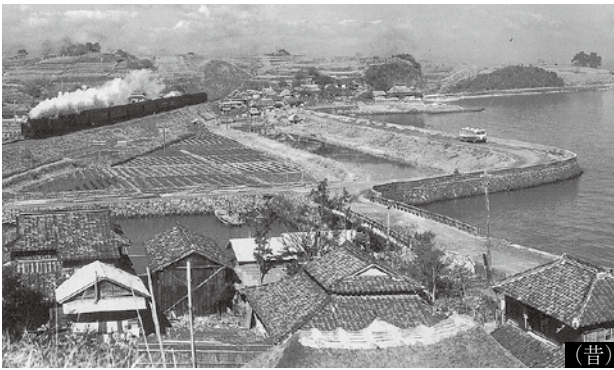
伊福地区の海岸風景