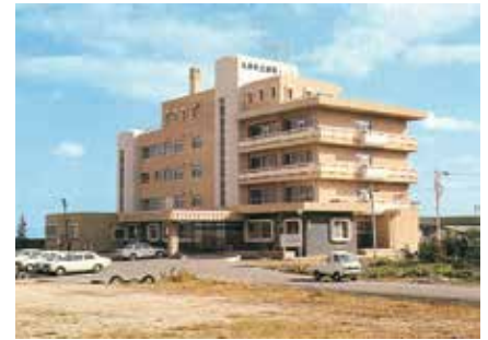
昭和48年10月 町立多良病院全面改築移転工事完成