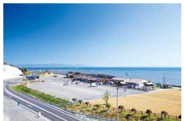
平成12年3月 公有地造成護岸等整備事業完了 (現在の道の駅太良)