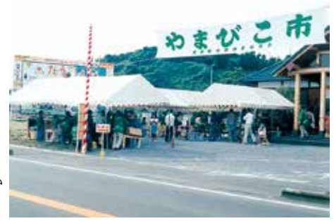
平成元年10月 第1回やまびこ市開催