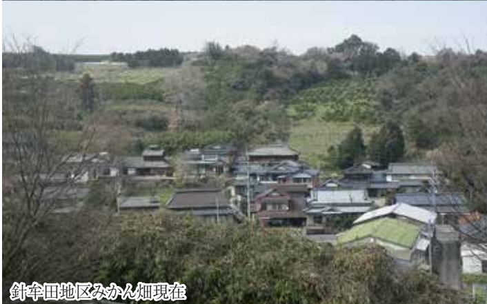
針傘田地区みかん畑現在