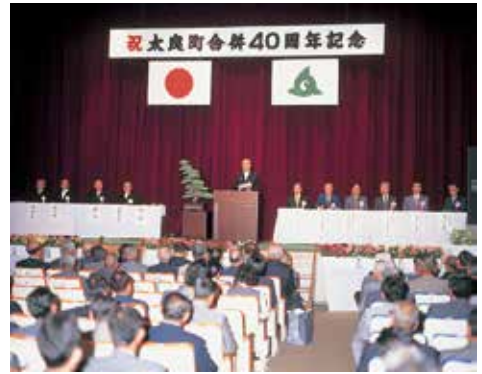
平成7年6月 太良町合併40周年記念式典