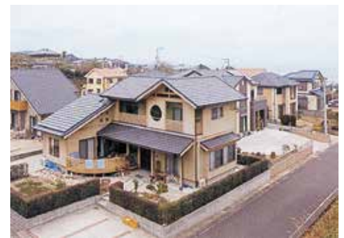
平成11年3月 野崎住宅分譲地造成工事完了 (現在の野崎住宅分譲地)