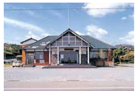
平成元年3月 太良町森林活性化センター完成