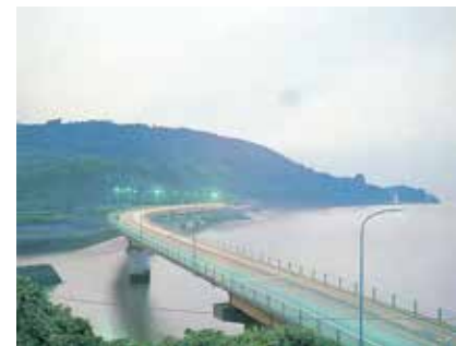
昭和50年4月 波瀬ノ浦大橋開通式