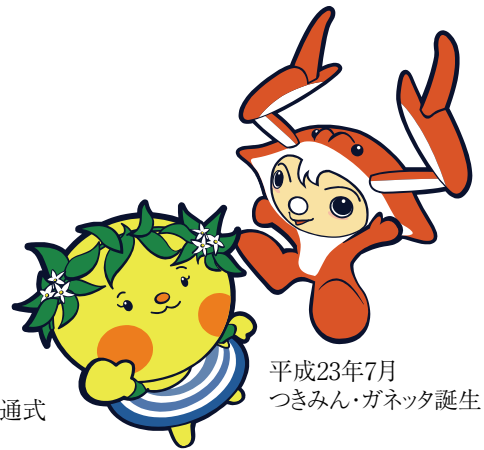
平成23年7月 つきみん・ガネッタ誕生