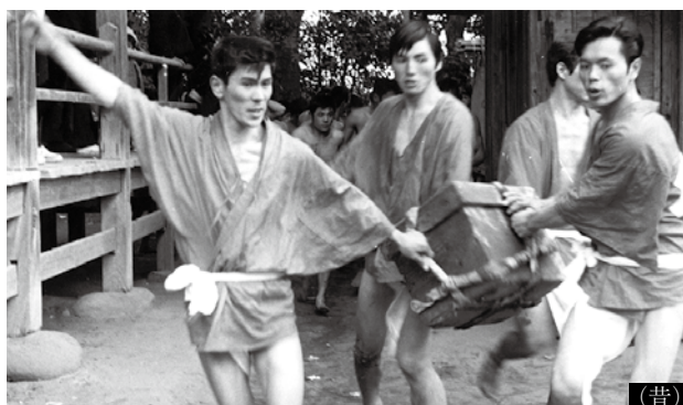
竹崎観世音寺修正会鬼祭