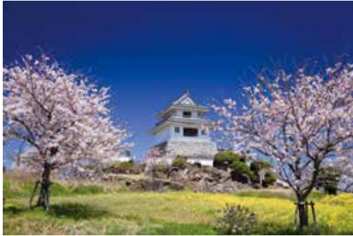
平成4年9月 竹崎城址展望台落成 (現在の竹崎城址展望台)