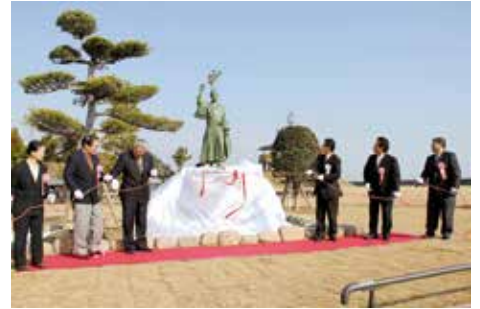
平成21年12月 「道の駅太良」グランドオープン記念式典