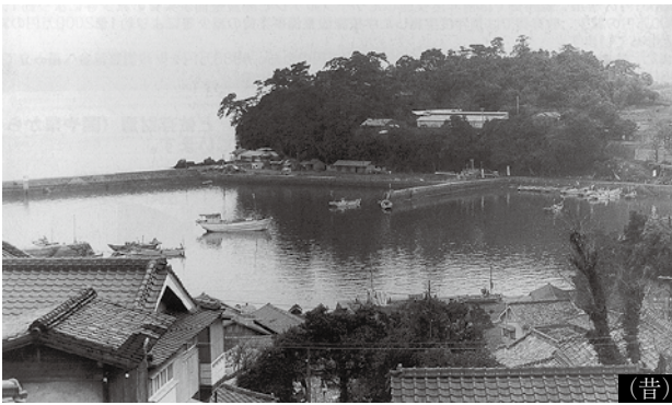
竹崎港から東望公園の風景