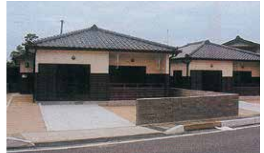
平成17年3月 瀬戸団地新築工事完了