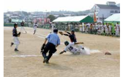
平成19年7月 全国高校総体男子ソフトボール競技 鹿島市・太良町で開催