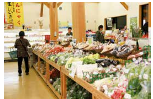
平成17年5月 太良町特産品販売所「たらふく館」オープン