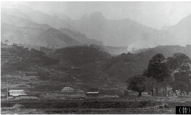
川上神社を手に前に多良山系を望む