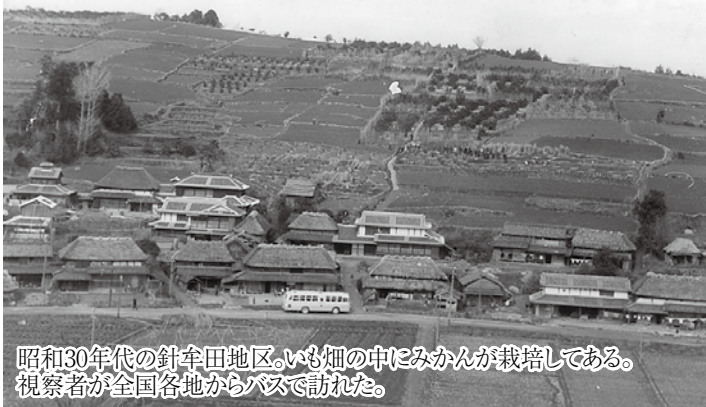
昭和30年代の針傘田地区。いも畑の中にみかんが栽培してある。視察者が全国各地からバスで訪れた。