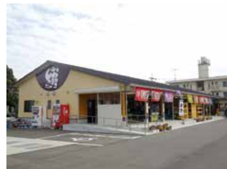
平成26年6月 太良町特産品振興施設「しおまねき」新築工事完了