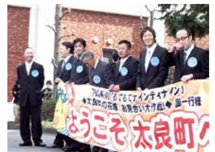
平成24年3月 TBSもてもてナインティナイン 「太良の花嫁 お見合い大作戦」開催