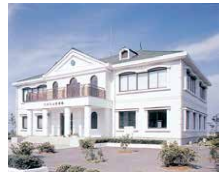
昭和61年5月 大橋記念図書館落成式