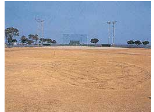
昭和49年10月 町営野球場完成