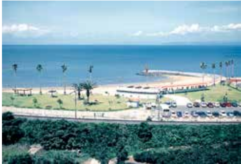
平成6年7月 海岸環境整備事業完了