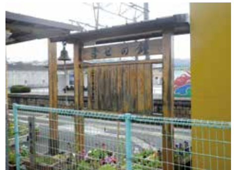
平成22年7月 多良駅「幸せの鐘」除幕式