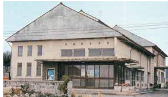
昭和33年3月 太良町立多良公民館完成