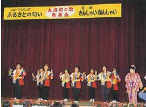
平成7年3月 太良町の歌制定