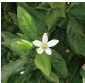
町の花 (みかんの花)