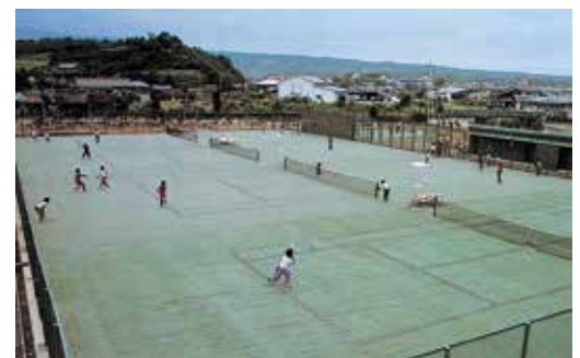
昭和52年3月 町営テニスコート落成