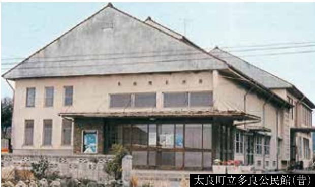
太良町中央公民館