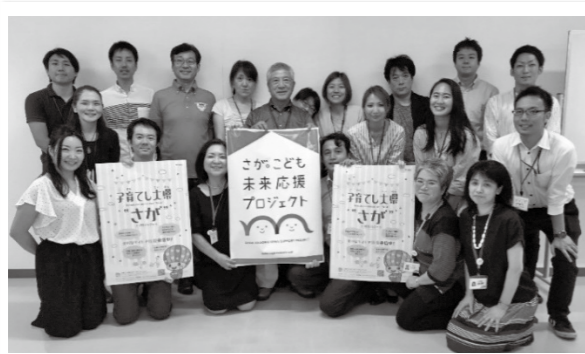
「子どもの居場所」づくりの支援スタッフ