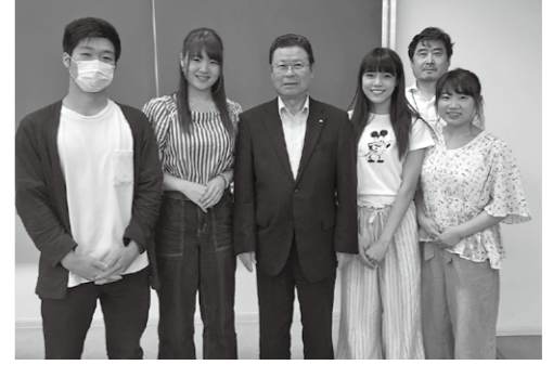
町長とグループ発表の代表者の皆さん