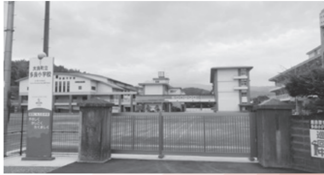
多良小学校屋外運動場改修事業および外構整備事業