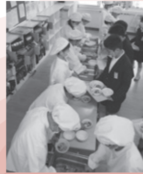
学校給食費補助金