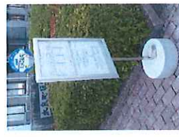
バス停標識 (太良町役場)