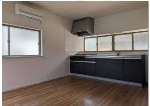
ダイニングキッチン8帖