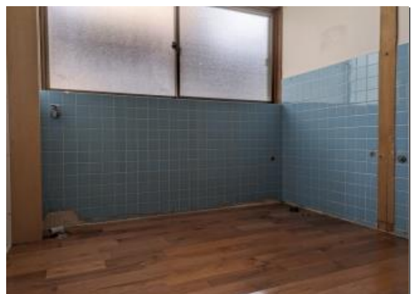
洗面・脱衣所（洗面台未設置）