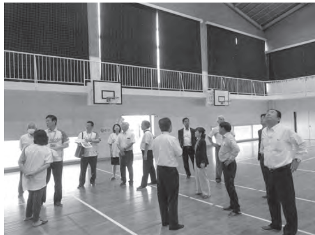
大浦小学校屋内運動場改修工事