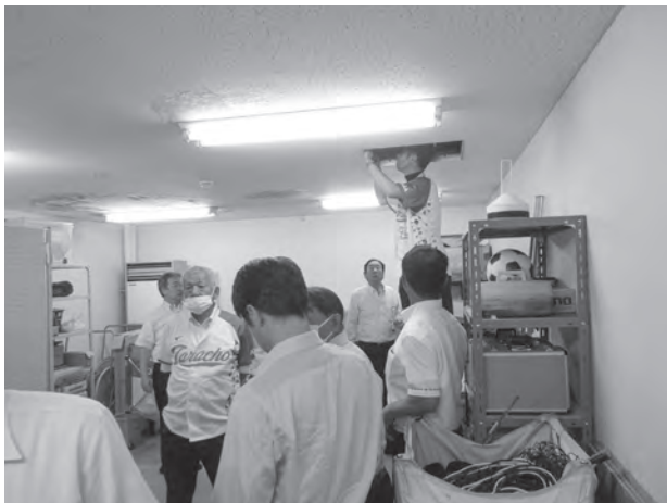
B &amp; G海洋センター体育館屋根防水改修工事

6月12日、今回の6月補正予算の主要事業であるB & G海洋センター体育館屋根防水改修工事と大浦小学校屋内運動場改修工事について調査しました。