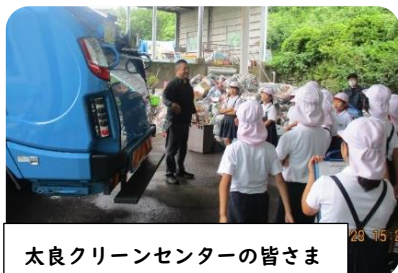
太良クリーンセンターの皆さま

大浦小4年生が、太良町リサイクルセンターへ見学に行き、太良町のリサイクルの様子を学習しました。