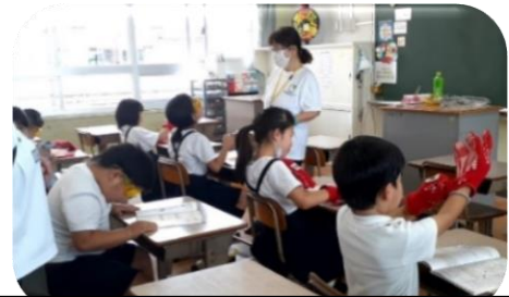
指先の動かしづらさや見えにくさの体験