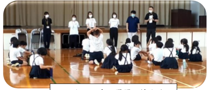
ふるさとの森の職員の皆さま

道の駅太良たらふく館より、今年もさつま芋の苗を小学校へ準備していただきました。ありがとうございました。