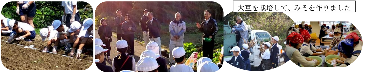
大豆を栽培して、みそを作りました

多良小3年生「大豆の学習」 JAさがみどり地区たら支所より、年間を通して指導してもらいました